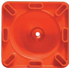
Base con 8 puntos de apoyo.